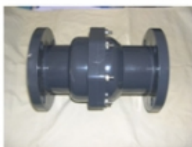
CHEQUE HORIZ. PLATILLADO PVC SCH-80

CHEQUE HORIZ. PLATILLADO SCH-80 [Detalles producto...]