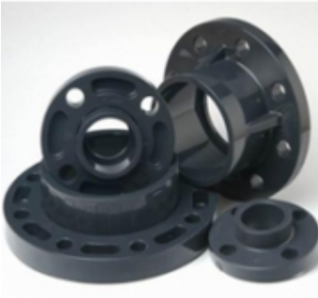
PLATILLO GIRATORIO SCH-80 pvc

PLATILLO GIRATORIO BLANCO SCH-80 [Detalles producto...]