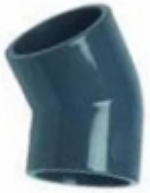
CODO 45 PVC SCH-80

CODO 45 PVC SCH-80 [Detalles product...]