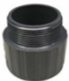
ADAPTADOR MACHO PVC SCH-80

ADAPTADOR HEMBRA PVC SCH-80 [Detalles producto...]