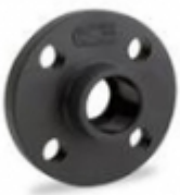
PLATILLO Ñ³ BRIDA FIJOS SCH-80 PVC

PLATILLO GIRATORIO SCH-80 2 - 12" PVC [Detalles producto...]