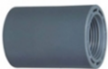
COUPLING C/ROSCA PVC SCH-80

CODO 90 PVC SCH-80 [Detalles product...]