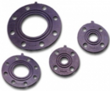
JUNTA DE GOMA P/ PLATILLOS PVC

COUPLING PVC SCH-80 [Detalles producto...]