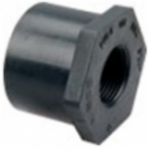
REDUCCION BUSHING SCH-80 PVC

REDUCCION BUSHING SCH-80 PVC [Detalles producto...]