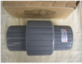
CHEQUE HORIZONTAL UNIVERSAL PVC SCH-80

CHEQUE HORIZONTAL UNIVERSAL PVC SCH-80 [Detalles producto...]