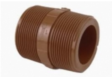
NIPLE PVC SCH-80

JUNTA DE GOMA P/ PLATILLOS [Detalles producto...]