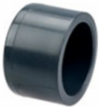
TAPON HEMBRA PVC SCH-80

REDUCCION COPA PVC SCH-80 [Detalles producto...]