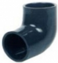
CODO 90 PVC SCH-80

CODO 45 PVC SCH-80 [Detalles product...]