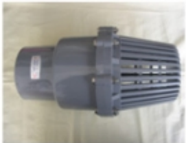
CHEQUE VERTICAL \tilde{\text{A}}^3 DE SUCCION C/ CAMPANA PVC SCH-80

CHEQUE HORIZONTAL UNIVERSAL PVC SCH-80 [Detalles producto...]