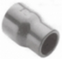
REDUCCION COPA PVC SCH-80

REDUCCION BUSHING SCH-80 PVC [Detalles producto...]