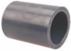
COUPLING PVC SCH-80

COUPLING PVC SCH-80 [Detalles producto...]