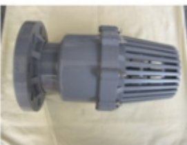
CHEQUE VERTICAL \tilde{\text{A}}^3 DE SUCCION P/PLATILLO PVC SCH-80

CHEQUE VERTICAL \tilde{\text{A}}^3 DE SUCCION C/ CAMPANA SCH-80 [Detalles producto...]