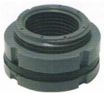
ADAPTADOR PARA TINACO PVC SCH80