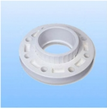
PLATILLO GIRATORIO BLANCO SCH-80

PLATILLO GIRATORIO BLANCO SCH-80 [Detalles producto...]