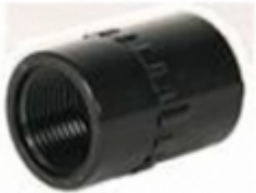
ADAPTADOR HEMBRA PVC SCH-80

ADAPTADOR HEMBRA PVC SCH-80 [Detalles producto...]