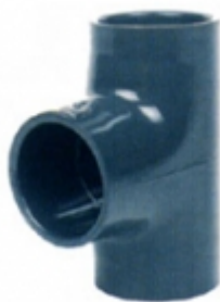
TEE PVC SCH-80 PVC

TAPON HEMBRA PVC SCH-80 [Detalles producto...]