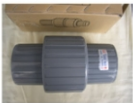
CHEQUE HORIZONTAL UNIVERSAL PVC SCH-80

CHEQUE HORIZONTAL PVC SCH-80 [Detalles producto...]