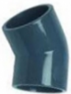
CODO 45 PVC SCH-80

CHEQUE VERTICAL Å³ DE SUCCION P/PLATILLO SCH-80 [Detalles producto...]