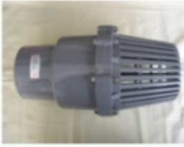
CHEQUE VERTICAL Å³ DE SUCCION C/ CAMPANA PVC SCH-80

CHEQUE VERTICAL Å³ DE SUCCION C/ CAMPANA SCH-80 [Detalles producto...]