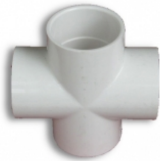
CRUZ SCH 40 PVC PRESION