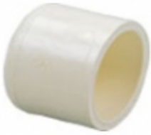
TAPON H. CPVC SDR-11

TAPON H. CPVC SDR-11 [Detalles producto...]