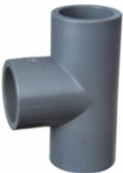
TEE CPVC SCH-80

TAPON HEMBRA CPVC SCH-80 [Detalles producto...]