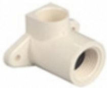
CODO 90 TIPO DROP C/ROSCA

CODO 90 TIPO DROP C/ROSCA [Detalles product...]