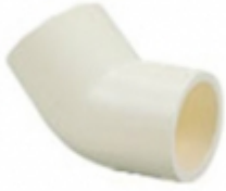
CODO 45 CPVC SDR-11

CODO 45 CPVC SDR-11 [Detalles productivo...]