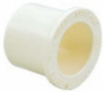
REDUCCION BUSHING CPVC SDR-11

REDUCCION BUSHING CPVC SDR-11 [Detalles producto...]