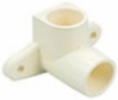
CODO 90 TIPO DROP