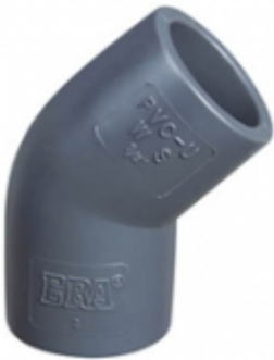
CODO 45 CPVC SCH-80

ADAPTADOR MACHO CPVC SCH-80 [Detalles producto...]