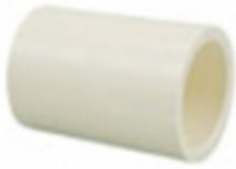
COUPLING CPVC SDR-11

COUPLING CPVC SDR-11 [Detalles producto...]