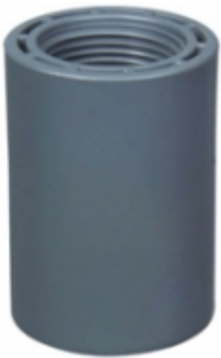
ADAPTADOR HEMBRA CPVC 80

ADAPTADOR H. CPVC SDR-11 [Detalles producto...]