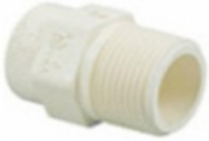
ADAPTADOR M. CPVC SDR-11

ADAPTADOR M. CPVC SDR-11 [Detalles producto...]