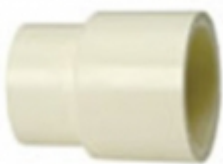
REDUCCION COPA CPVC SDR-11

REDUCCION COPA CPVC SCH-80 [Detalles producto...]