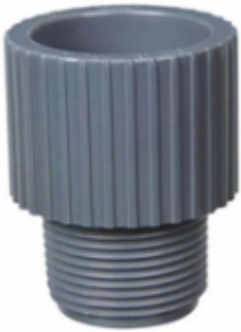
ADAPTADOR MACHO CPVC SCH-80

ADAPTADOR M. CPVC SDR-11 [Detalles producto...]