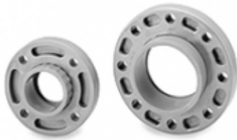
PLATILLO GIRATORIO CPVC SCH-80

COUPLING CPVC SDR-11 [Detalles producto...]