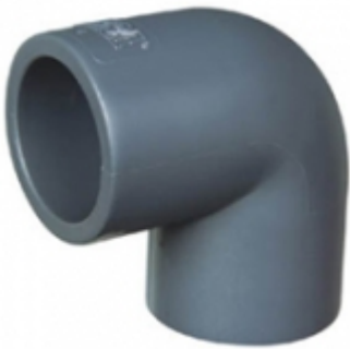
CODO 90 CPVC SCH-80

CODO 45 CPVC SDR-11 [Detalles productivo...]