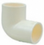
CODO 90 CPVC SDR-11

CODO 90 CPVC SCH-80 [Detalles productivo...]