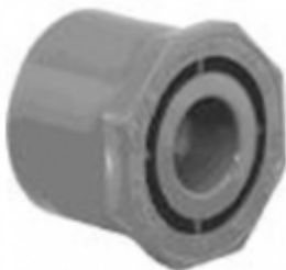
REDUCCION B. CPVC SCH-80

PLATILLO GIRATORIO CPVC SCH-80 [Detalles producto...]