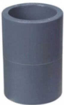
COUPLING CPVC SCH-80

CODO 90 TIPO DROP C/ROSCA [Detalles product...]