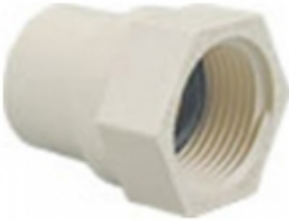
ADAPTADOR H. CPVC SDR-11

ADAPTADOR H. CPVC SDR-11 [Detalles producto...]