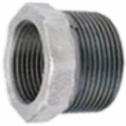
REDUCCION BUSHING HG

REDUCCIONES BUSHING HG [Detalles producto...]