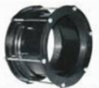
UNION DRESSER METAL HG

UNIÓN UNIVERSAL MÁXIMO RANGO (RT) Utilizadas para unir tuberías tubulares de diferentes materiales (PUVC, PVC, CPVC y Acero al Carbono) de diámetros nominales iguales.