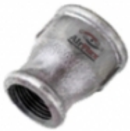
REDUCCION COPA HG

REDUCCIONES BUSHING HG [Detalles producto...]