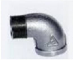
CODO NIPLE 90 HG