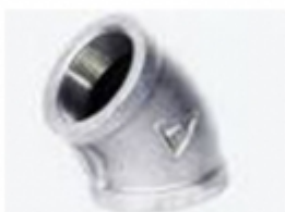
CODO 45 HG

ADAPTADOR P/BOMBA HG [Detalles producto...]