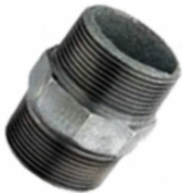
ADAPTADOR P/BOMBA HG

ADAPTADOR P/BOMBA HG [Detalles producto...]