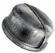
TAPON HEMBRA HG

REDUCCION COPA HG [Detalles producto...]