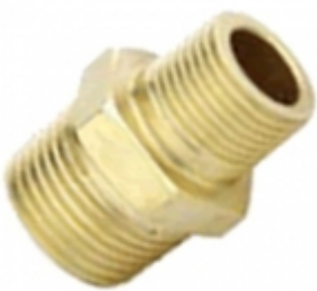
ADAPTADOR BOMBA BRONCE HG

ADAPTADOR BOMBA BRONCE HG [Detalles producto...]