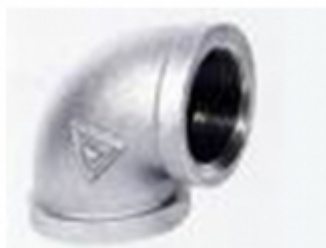
CODO 90 HG